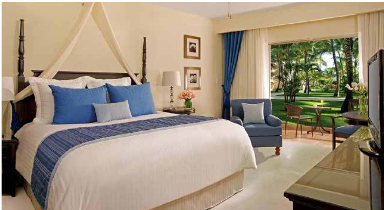
FOTO: HABITACIÓN DELUXE TROPICAL VIEW