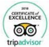
CERTIFICADO DE EXCELENCIA TRIPADVISOR 2018