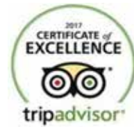
CERTIFICADO DE EXCELENCIA TRIPADVISOR 2017