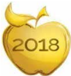
GOLDEN APPLE 2018