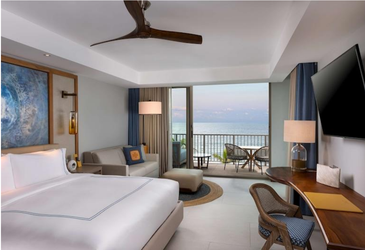
FOTO: HABITACIÓN KING CON VISTA AL MAR

Conrad Punta de Mita ofrece 324 alojamientos con caja fuerte y cafetera y tetera. Las habitaciones disponen de balcón o patio con mobiliario. Se ofrece un televisión LCD en todas las habitaciones. Los baños están equipados con bañera o ducha, albornoces, zapatillas y artículos de higiene personal gratuitos.